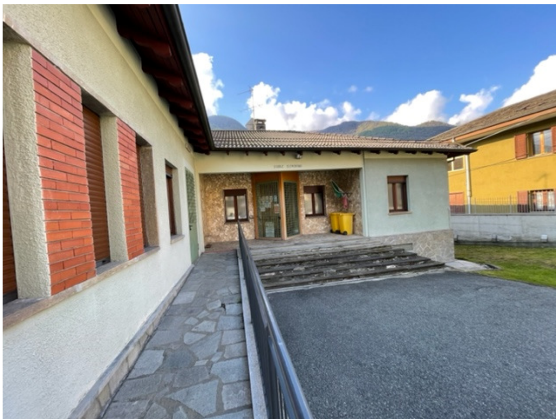
Fotografia 1 – Prospetto nord