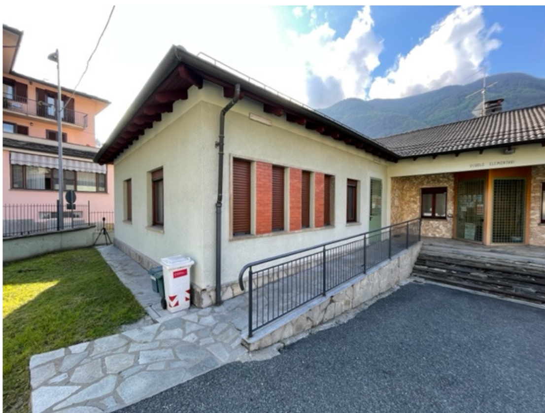
Fotografia 2 – Prospetto nord e ovest