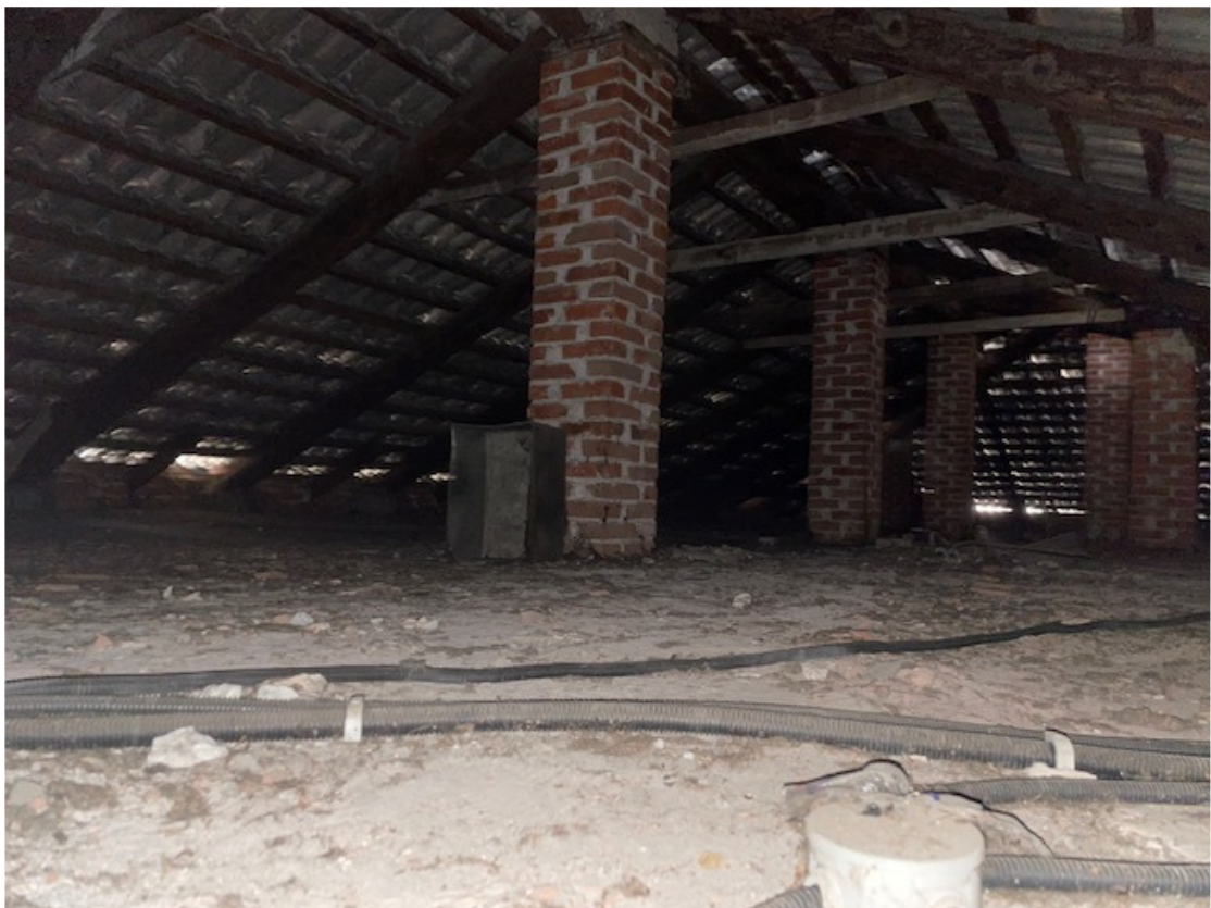
Fotografia 4 – Vista su sottotetto