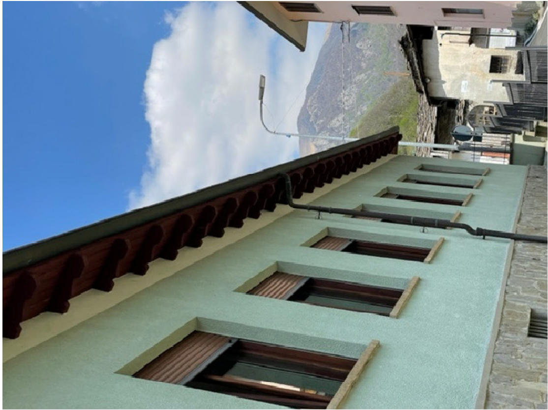
Fotografia 3 – Prospetto est